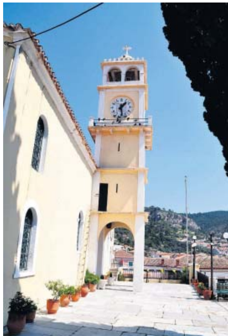
Kerken zijn er in vele soorten en maten op Evia. Hier het kerkje in Limni.

Meer dan veertig procent van alle potentiële bezoekers aan Engeland geeft aan van plan te zijn een voetbalwedstrijd bij te wonen en in 2007 deden 1,2 miljoen toeristen dat ook daadwerkelijk.