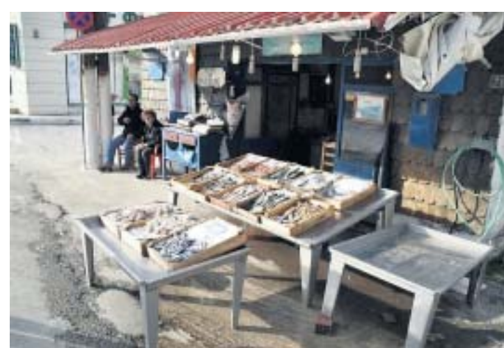
Over eten niets te klagen. Kan ook niet anders met zoveel verse producten. Op de foto een viswinkel in Amarnythos.

Het noorden van Evia is groener dan groen. In het hart van Evia liggen de bergen Dirfis (1743 meter) en de Olympos (1171 meter). In het zuiden de berg Ochi (1398 meter). Evia dankt zijn groene jasje en vruchtbaarheid aan de toppen van deze bergen waar het in de winter maanden sneeuwt. Smeltwater zorgt voor voldoende water op het eiland. Een adembenemende rit brengt ons langs dorpijjes waar het eenvoudige boerenleven zo te zien goed moet zijn. Eén van die dorpijjes, Prokopi, is een bekende bedevaartsplaats, Griekse, Servische en Russische Orthodoxe gelovigen komen van verre om in de kerk, waar het lichaam van de heilige Ioannis (geb. 1690) ligt, te bidden. Op zijn naamdag lopen gelovigen