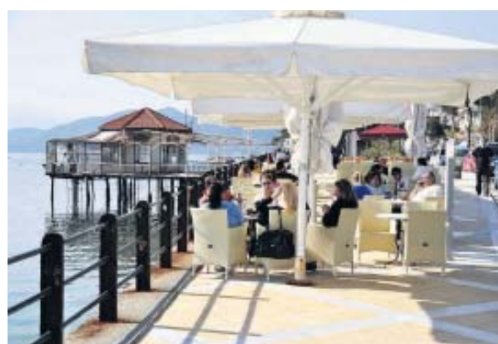
Het is goed toeven op een van de vele terrasjes in Aedipsos. Links het vervallen kiosk-restaurant van het Griekse bureau voor toerisme.