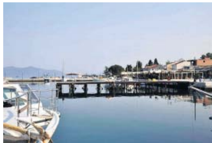
Vanuit Orei kun je prachtige vaartochten maken.